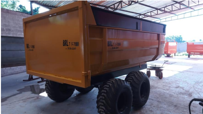
Figura 01: caçamba TF-7000