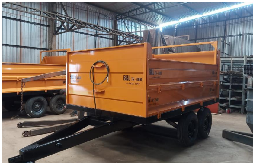
Figura 03: caçamba TR-7000