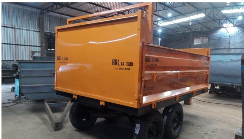
Figura 04: caçamba TR-7000