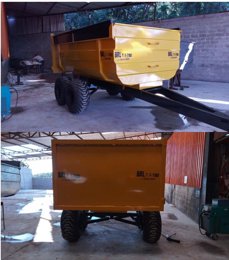
Figura 02: caçamba TF-7000